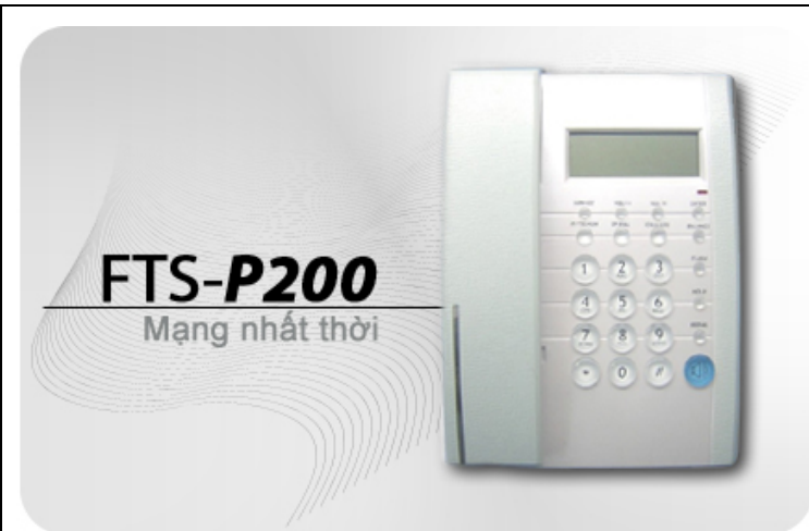
Điện thoại mạng kỹ thuật số FTS-P200