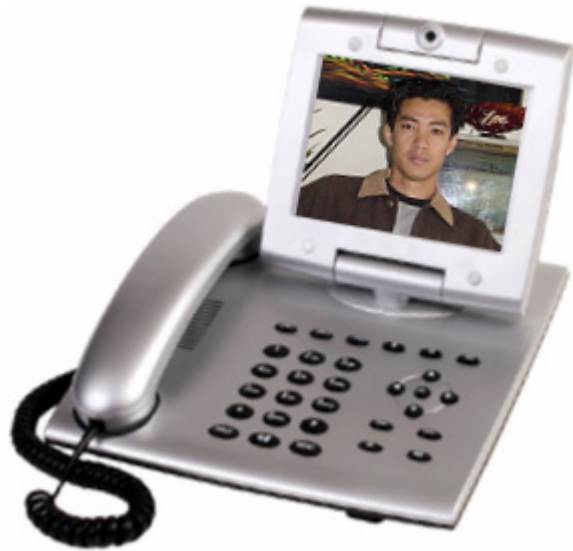
FreeTEL System Điện Thoại Video FTS-V100 Bản 1.0